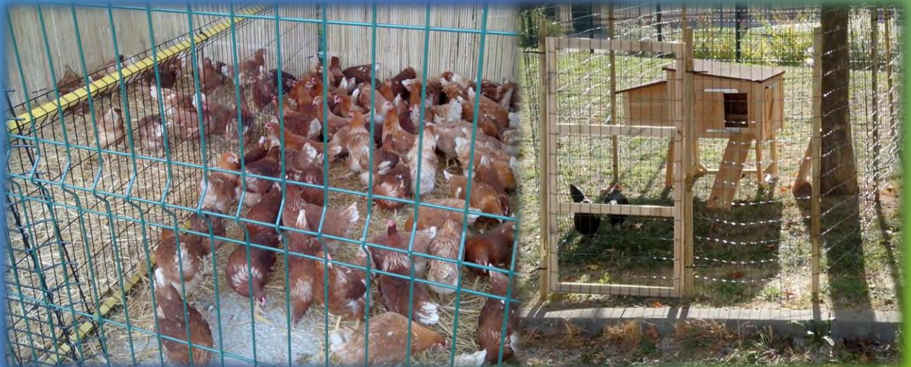
Mise à disposition de poules pondeuses dans le cadre du Programme Local de Prévention des déchets