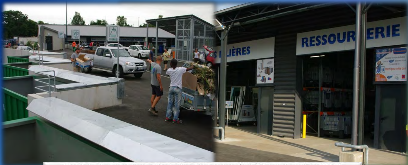
Centre de recyclage du Ladhof inauguré le 26 septembre 2015